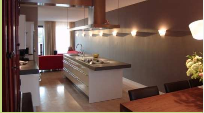
Fraaie woning met schitterende tuin